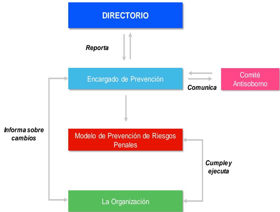
Ilustración 2 - Esquema de funcionamiento del Modelo de Prevención de Riesgos Penales

A continuación, se definen las responsabilidades que tiene cada uno de estos órganos en las distintas etapas del proceso (diseño, operatividad, supervisión y reporting):